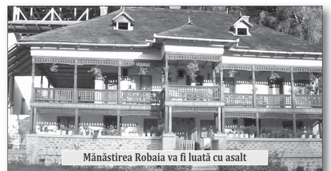
Mănăstirea Robaia va fi luată cu asalt