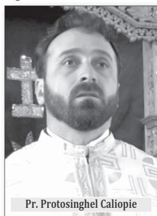
Pr. Protosinghel Caliope

Ieri s-a încheiat ședința Sf. Sinod al Patriarhiei Române și, conform comunicatului de presă, s-au luat decizii importante și-n privința „rotirii” cadrelor. Un cleric a fost promovată la rang de episcop, iar un înalt ierarh a fost mutat în altă eparhie. Una dintre aceste „mutări” a stârmit și interesul clericilor și mirenilor argeșeni. Este vorba despre faptul că, prin trimiterea episcopului-vicar Emilian Lovișteanul de la Arhiepiscopia Râmnicului tocmai la Arad, s-a creat un post vacant în apropierea Curții de Argeș, în județul vecin, „peste dealuri” cum obișnuiesc mulți să spună despre ținutul vâlcean. Nu mai are cine-l secunda la conducerea eparhiei pe arhiepiscopul Varsanufie, astfel că mulți preoți, stareți, dar și dreptcredincioși de rând fac calcule. Se-nțelege că, teoretic, prioritate pentru a ocupa funcția de vicar al Râmnicului ar avea un cleric vâlcean. Totuși există o cutumă. În ultimii ani s-a