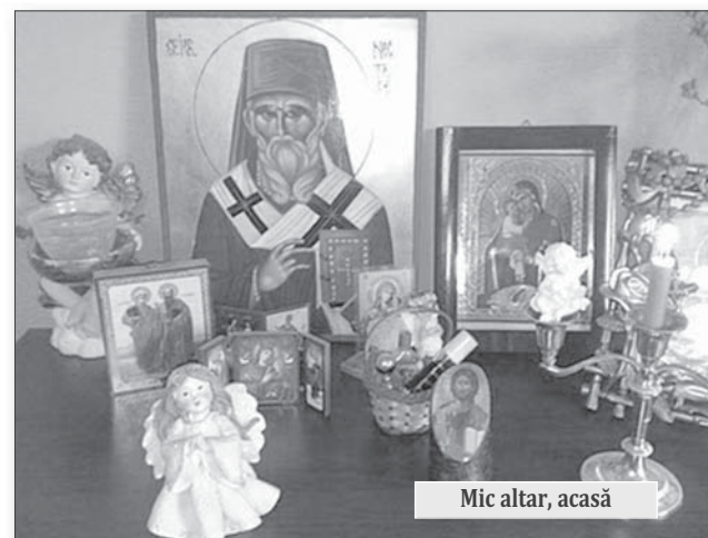
Mic altar, acasă

În urmă cu aproximativ doi ani, câțiva credincioși care frecventau o mănăstire din apropierea Bucureștiului au avut o inițiativă care s-a extins și-n Pitești. Această practică se numește „Candela nestinsă“, iar adepții ei sunt din ce în ce mai mulți. Într-una dintre povețele Sale, Hristos ne îndeamnă să ne rugăm „unii pentru alții“ și, combinând acest sfat cu cel al apostolului, de a ne „ruga neîncetat“, s-a