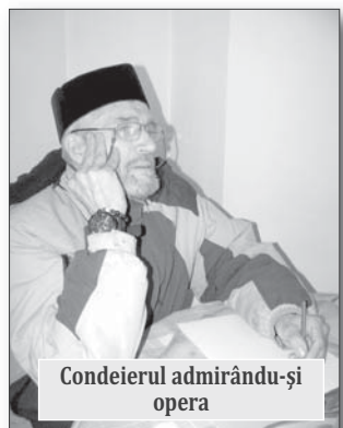
Condeierul admirându-și opera