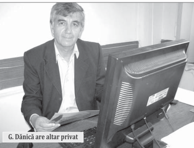
G. Dănică are altar privat

jumătate de oră, după calcule minuțioase legate de serviciul fiecăruia, pauze, copii, familie etc. Se ajunge la o programare „matematică“ strictă și fiecare știe în care moment din zi sau din noapte să-și plece genunchii în fața icoanelor. În