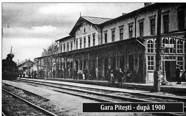
Gara Pitești - după 1900

izbândă nici alte asemenea studii, întocmite pe la 1941 de Al. Zamfiropol și Kikero Constantinescu. (Este deosebită, de altfel, prin felul în care transpare din documentele de arhivă, atenția arătată de la vârful țării față de Pitești în anii dictaturii antonesciene, grija sporită pentru urbea în care „domnul Mareșal” se născuse și de unde funcționase la comanda Divizia a 3-a de armată!)