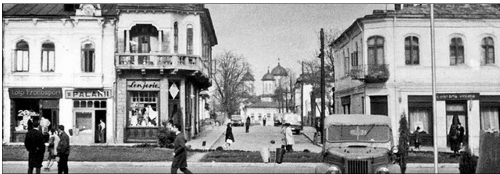
Strada Griviței, Biserica Maica Domnului, 1960

Încercările de primenire a orașului Pitești se petrec, în plin secol XIX, în acord cu avântul modernizării tânărului stat român. Stau mărturie pentru aceasta și vizitele unor figuri publice de prim rang ale vremii. Dintre acestea se distinge, imediat după Unirea Principatelor, marele om politic de orientare liberală Mihail Kogălniceanu, avocat, istoric și publicist originar din Moldova, prim-ministru al României în timpul domniei lui Cuza. În această calitate a avut ocazia, în vara anului 1864, să facă o vizită prin urbea Piteștilor. Călătoria sa în Muntenia a fost văzută de unii istorici drept o încercare de a cunoaște starea de spirit a populației de atunci privind reformele înfăptuite de domnitor.